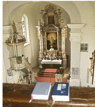
Simultankirche Wildenreuth St. Jakobus