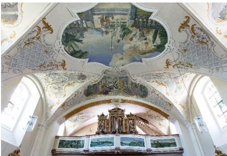
Simultankirche Illschwang St. Vitus St. Veit