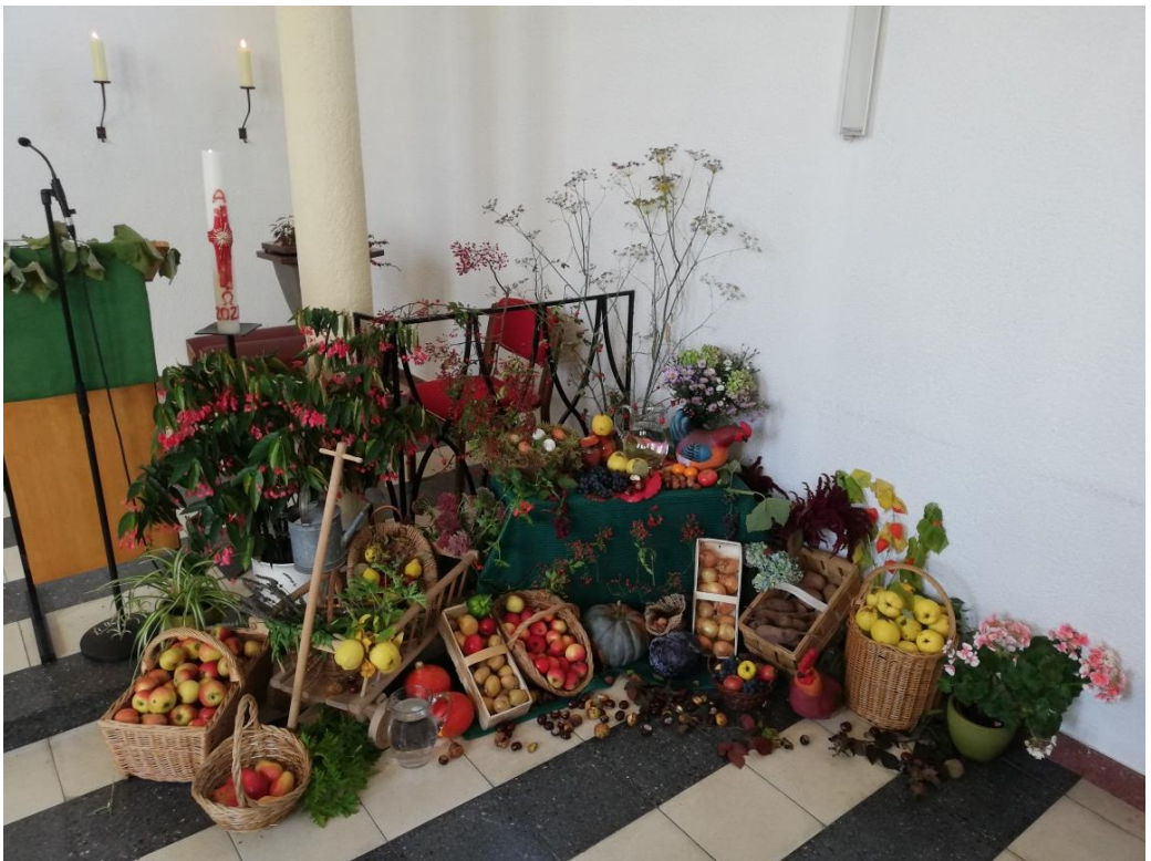
Schön geschmückte Kirche zum Erntedank in Weiherhammer am 09.10.2022